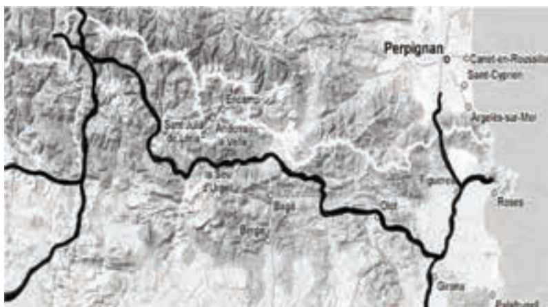
FIG # 3 EJE TRANSVERSAL PIRENAICO N-260-A-26